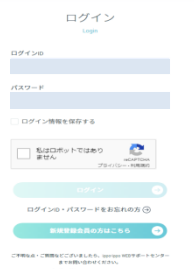
「ログインID・パスワードをお忘れの方」をクリック

QUPIO Plusのログイン画面で「ログインIDパスワードをお忘れの方」へクリックし、画面の案内に沿って再設定を行います