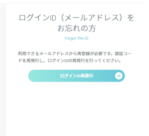
メールアドレスをお忘れの方は 「ログインの再発行」をクリック