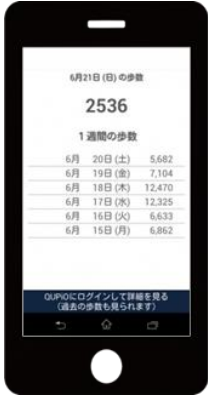
※上記はイメージです

「QUPIO Plus歩数計アプリ」を利用すると、歩数記録がQUPIO Plusに連携できます。