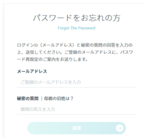
パスワードをお忘れの方は メールアドレスと秘密の質問を 入力し「送信」をクリック