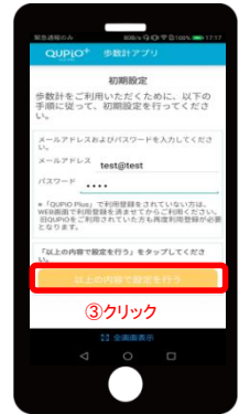
3. 「上記の内容で設定を行う」を クリック