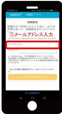
1. QUPIO Plusに登録している メールアドレスを入力

歩数計アプリをご利用いただくには、QUPIO Plusに初回登録していただき、ご登録されたメールアドレスとパスワードを歩数計アプリにご入力ください。